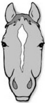
star and strip