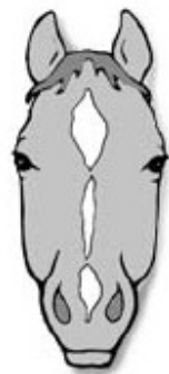
disconected star, strip and snip